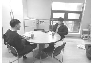
예수의 제자로 양육합니다