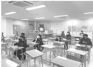
말씀도 배우고 영어도 공부합니다