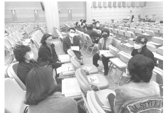
무엇이 청지기적 삶인가?