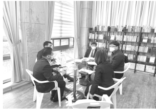
전도집회를 위한 리더십 회의 성령보다 기도보다 앞서지 않습니다.