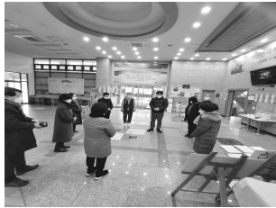
교회를 알리고 영혼을 구원합니다.