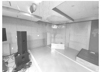
지하2층 천정배관 유지보수