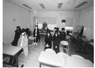
찬양팀 집회를 위한 중보기도