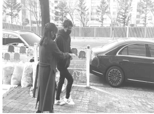
주일 오후 3시 티전도