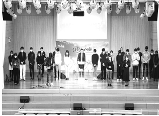
요셉청년부를 위한 합심기도