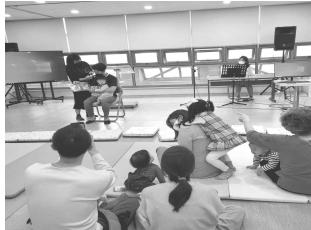
아빠가 읽어주는 동화