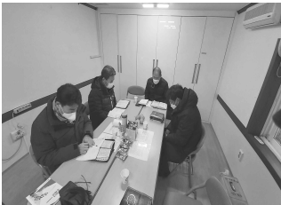
주일 1부 예배전 중보기도 장소 - 1층 주차장 청년부회의실