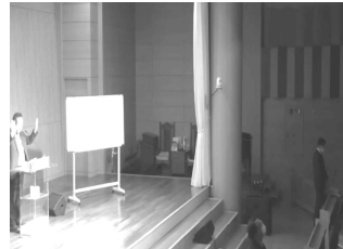
말씀과 성령의 조화로운 리더