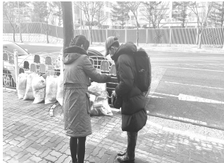
복음과 사랑을 전합니다!